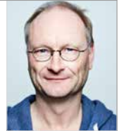
Sven Plöger, Diplom-Meteorologe und TV-Moderator «Das Wetter im Ersten.»

Im Vortrag erklärt Sven Plöger , warum das vergangene Jahr nicht nur ein « Wetterausrutscher » war, sondern ein klares Ergebnis des deutlichen Klimatrends . Dabei wird verständlich erklärt, warum sich Starkregen und Hochwasser auf der einen und Dürren und Hitze auf der anderen Seite häufen werden. Und die Folgen für die Süßwarenindustrie ? Nur noch Eiscreme verkaufen und einfach gar keinen Lebkuchen mehr herstellen? Oder Schokolade nur noch mit Kühlschranks anbieten? Auf welche Wetterabläufe müssen wir uns einstellen? Was muss sich bei Verpackung und der Logistik ändern? Dies sind Fragen, die neben dem Kernthema Meteorologie auch besprochen werden.