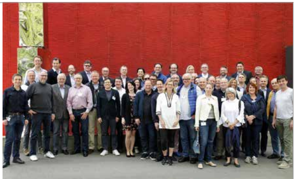
Die Tessiner Innovatorinnen und Innovatoren 2018